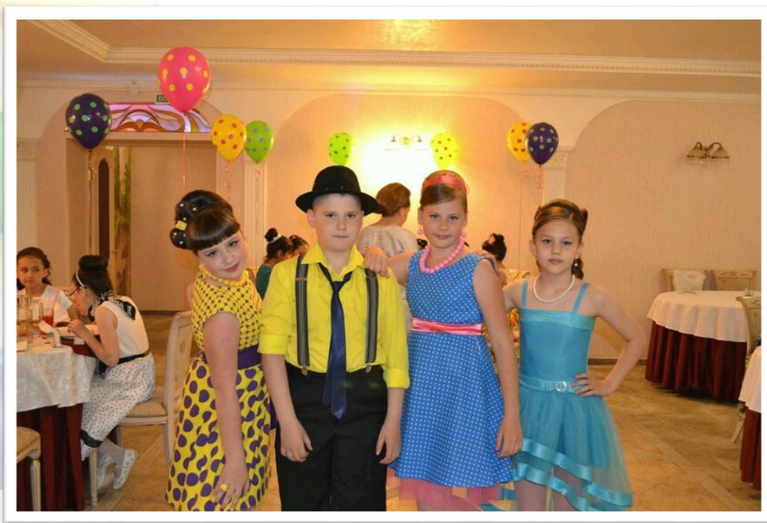
Выпускной вечер 4Б